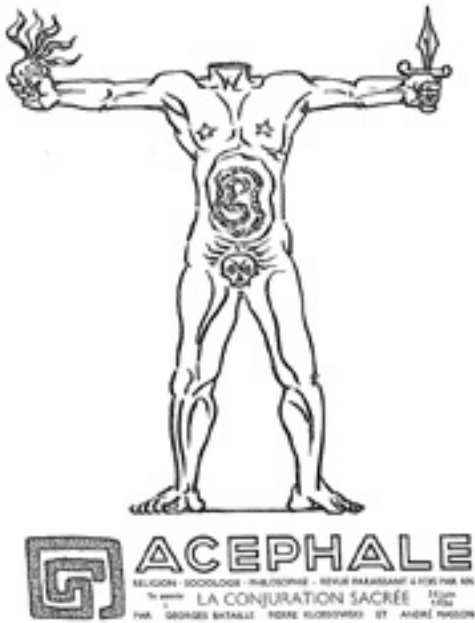
»André Masson, Acéphale , 1936«

1936 gab Bataille André Masson den Auftrag, sich einen Mann ohne Kopf vorzustellen, und Masson fertigte daraufhin – in nach eigenen Angaben »automatischem« Verfahren – die Zeichnung an, die, in zahlreichen Modifikationen, emblematisch für die Zeitschrift wie für die Geheimgesellschaft werden sollte. 34 In Massons ikonischer Grafik zeigt sich der Acéphale als ein muskulöser Männerkörper, dessen Kopf am Rumpf abgetrennt ist, beide Arme seitlich ausgestreckt, in der einen Hand ein Schwert, in der anderen ein Herz, aus dem Flammen steigen, haltend. An Stelle des Genitales ist ein Totenkopf zu erkennen und der Bauchraum ist transparent, so dass das »Labyrinth der Eingeweide« 35 sichtbar ist. Auffällig ist, dass hier der am Rumpf fehlende Kopf in umgestalteter Form am Leib, genauer gesagt, an Stelle des – daher ebenfalls fehlenden – Genitales wiederauftaucht. In dieser Verschiebung folgt Masson jedoch – ob wissentlich oder nicht – einem ikonografischen Schema.